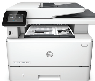
Urządzenie wielofunkcyjne HP LaserJet Pro M426fdn

Szybkie drukowanie, skanowanie, kopiowanie i faksowanie oraz zaawansowane, kompleksowe zabezpieczenia procesów roboczych. To urządzenie wielofunkcyjne zapewnia szybsze zakończenie podstawowych zadań i zapewnia ochronę przed zagrożeniami. 1 Oryginalne wkłady z tonerem HP z technologią JetIntelligence zapewniają wydruk większej ilości stron. 2