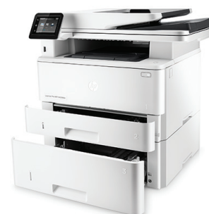
Urządzenie wielofunkcyjne HP LaserJet Pro M426fdw z opcjonalnym podajnikiem na 550 arkuszy