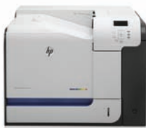
HP LaserJet Enterprise 500 color M551n