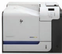
HP LaserJet Enterprise 500 color M551dn