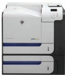
HP LaserJet Enterprise 500 color M551xh