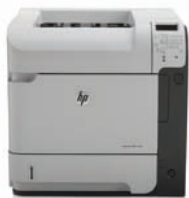
HP LaserJet Enterprise 600 M602dn