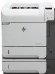
HP LaserJet Enterprise 600 M602x