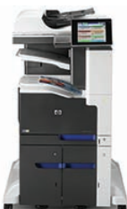
Urządzenie wielofunkcyjne HP LaserJet Enterprise 700 color M775z+