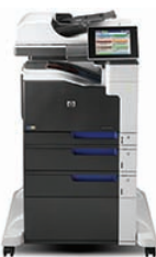
Urządzenie wielofunkcyjne HP LaserJet Enterprise 700 color M775f