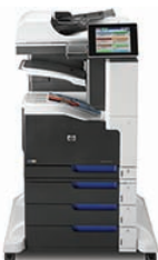
Urządzenie wielofunkcyjne HP LaserJet Enterprise 700 color M775z